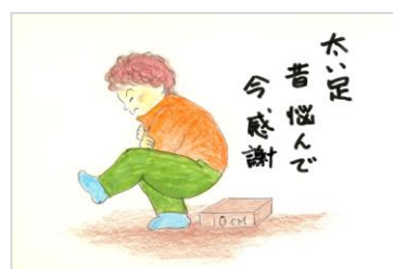
ponpoco さん 作