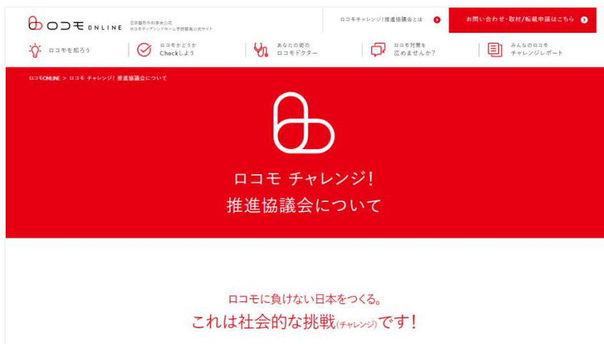
ロコモ ONLINE ( https://locomo-joa.jp/ )

ロコモ度テストに関しては、ロコモ チャレンジ！推進協議会が運営する Web サイト「ロコモ ONLINE」や、「ロコモパンフレット」において、実践・判定の方法をご覧いただけます。