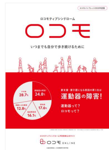
ロコモパンフレット 2020 年度版