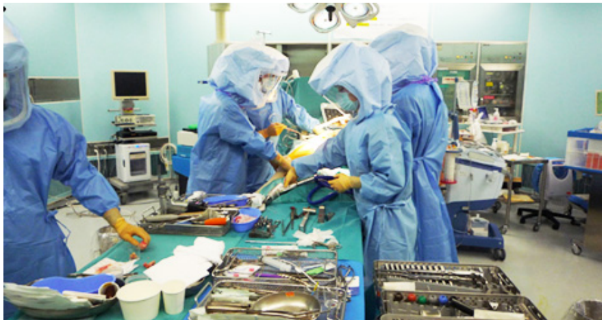
クリーンルームでの人工関節置換術

整形外科専門医は、国民に対して質の高い運動器医療を提供することが求められます。このため、整形外科専門医は、あらゆる運動器に関する科学的知識と高い社会的倫理観を備え、高い診療実践能力を有する必要があります。また、 常に探求心を持って、日々の疑問の解決に取り組み、その中から新たな知見を見出して、世の中に発信することで、医療と医学に貢献することも求められます。 さらに、コミュニケーション能力を高めて、患者だけでなく、医療関係者との信頼関係を構築することも日々の診療を円滑に行う上で非常に大切です。