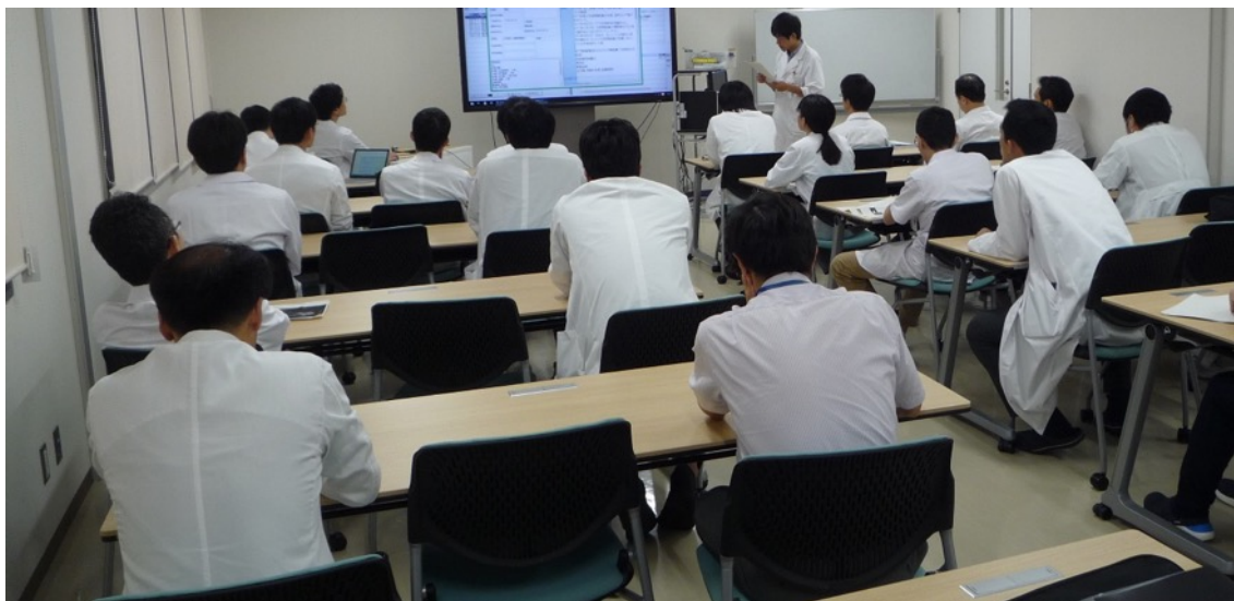
症例カンファレンス

研修プログラム終了後の進路としては、大きく分けて大学院へ進学するコースと、直接サブスペシャリティ領域の研修に進むコース、将来の開業準備などの為、専攻医の希望する地域の関連病院で臨床経験を積み重ねるコースがあります。大学院へ進学する場合、研修終了後の翌年度より整形外科に関連する大学院講座へ入学し、主に整形外科に関連する基礎研究を行います。また関連する臨床研究グループに属することにより、大学院卒業後のサブスペシャリティ領域の研修への移行を円滑に行います。大学院在学中および卒業後に、研究を深化させるための国内外への留学も積極的にサポートします。直接サブスペシャリティ領域に進む場合には、進みたい領域の専門診療班に所属し、京都大学整形外科ならびに連携施設において専門領域の研修を行います。また、地域の関連病院に就職して、あらゆる整形外科疾患に対応できる総合整形外科医を目指す道も開かれています。