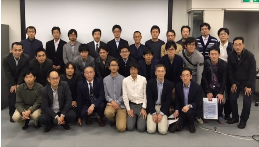
京整会若手脊椎の会

各研修施設の研修委員会の計画の下、症例検討・抄読会は全ての施設で行います。専門研修プログラム管理委員会とその所属する基幹、連携施設が企画する専攻医の知識・技能習得のための教育セミナーに併せて、症例検討会を開催し、症例経験を専攻医間で共有できるようにします。