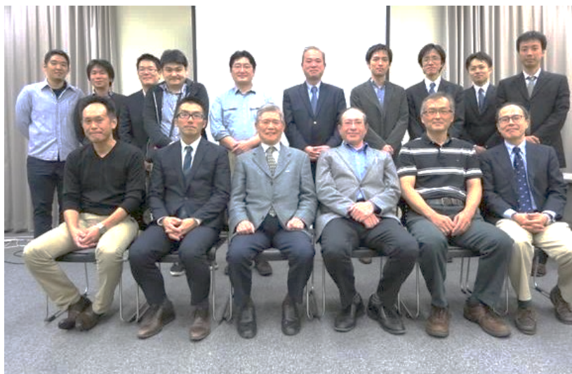
京大関連病院手外科集談会