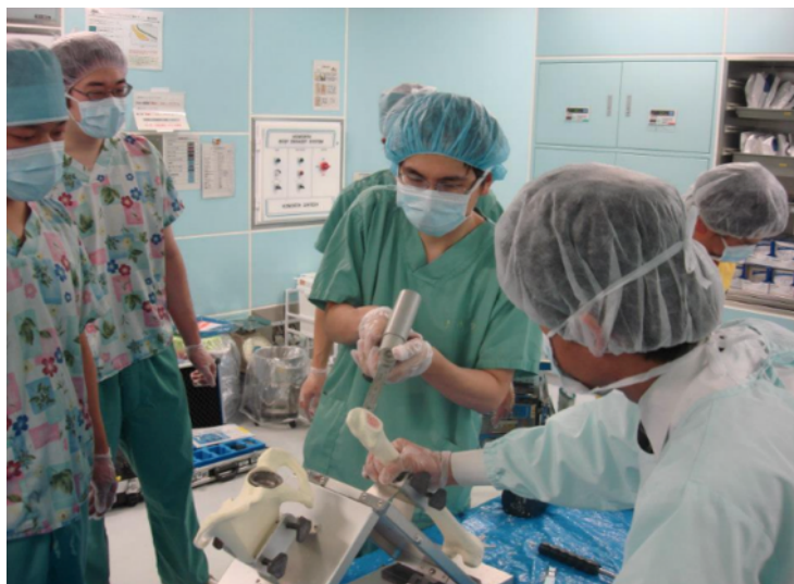
THA ハンズオンセミナー

経験すべき疾患・病態、診察・検査、手術処置等は、資料3「整形外科専門研修カリキュラム」に明示されています。手術手技は160例以上経験すること、そのうち術者としては80例以上を経験することとなっていますが、年間100例以上を目標に連携病院において主治医となって積極的に執刀していただきます。