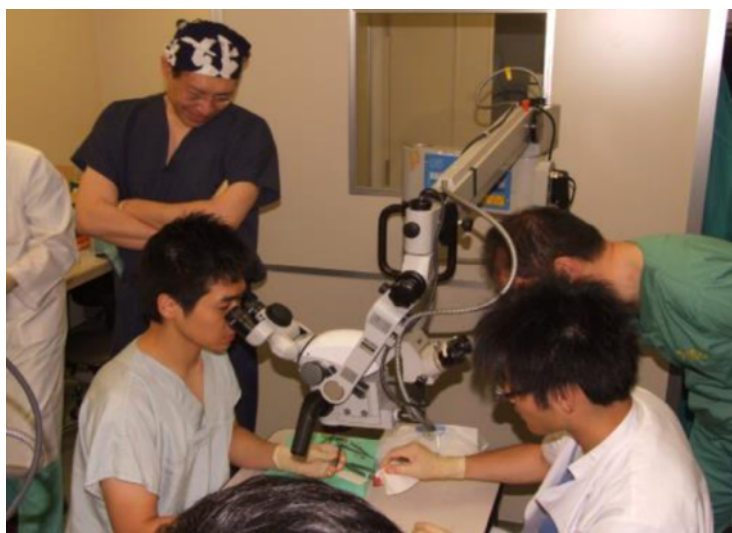
マイクロサージェリー講習会