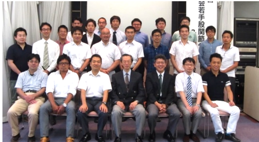
京整会若手 股関節セミナー