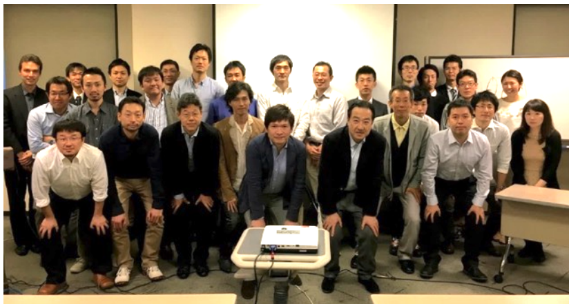
教育研修会一例：スポーツ整形に親しむ会（SPOSIN）

* 京都大学との双方向ネットワークと各連携病院間の緊密な連携、プログラム全体および地域毎の研修会での交流を通じて、全ての専攻医にレベルの高い研修を保証します。