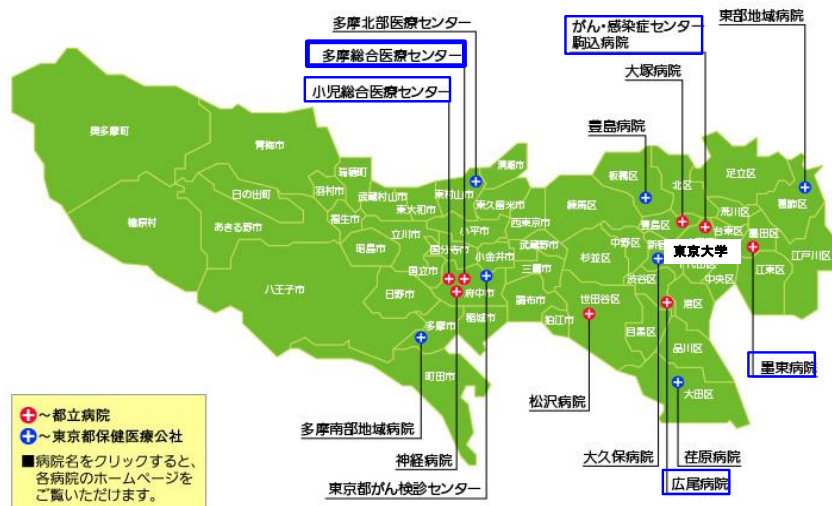
図2 Google map から改変