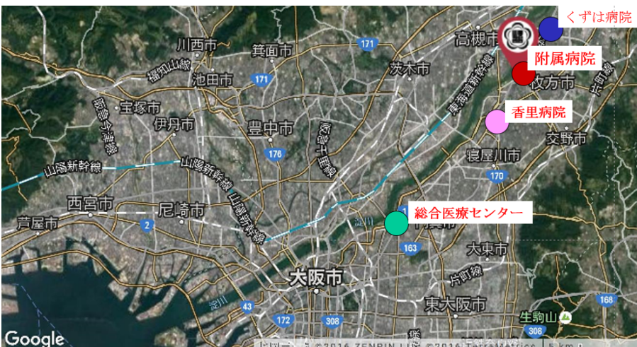
(附属 4 病院)

上級医の熱心な指導のもとで、専攻医も積極的に治療にたずさわっていただくため、関西医大専門研修プログラムは、整形外科専門医を目指す第一歩として適していると考えています。