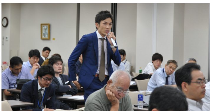
(研修会での質疑応答)

関西医科大学整形外科春期セミナー 関西医科大学整形外科秋期研修会 北河内整形外科セミナー 枚方セメントTHAセミナー 関西医科大学脊椎グループ研究会（KSG）年2回 術中脳脊髄モニタリングセミナー MISt手術手技セミナー 京阪手の外科セミナー 年2回