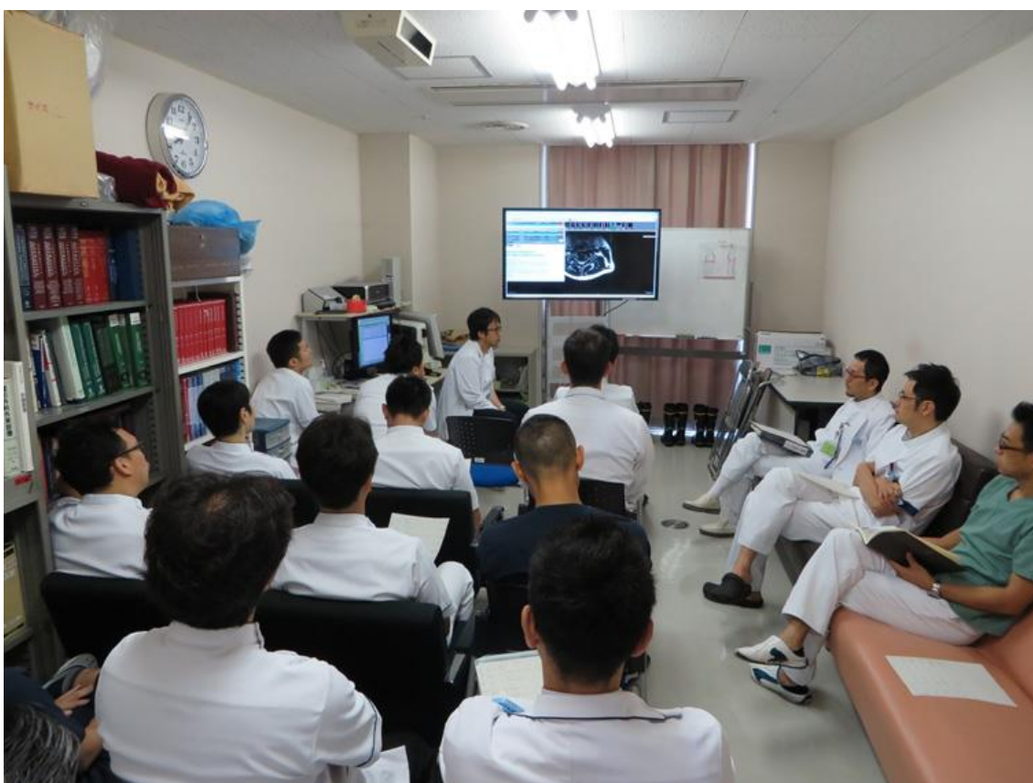
カンファレンスの風景

チーム医療の必要性を理解しチームのリーダーとして活動できること、的確なコンサルテーションができること、他のメディカルスタッフと協調して診療にあたることが求められます。本専門研修プログラムでは、指導医と共に個々の症例に対して、他のメディカルスタッフと議論・協調しながら、診断や治療の計画を立てて診療していく中でチーム医療の一員として参加し学ぶことができます。また、毎日行われる術前・術後カンファレンスでは、指導医と共にチーム医療の一員として、症例の提示や問題点等を議論していきます。