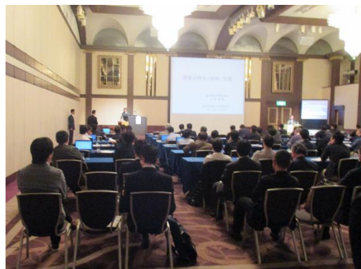
南大阪整形外科セミナー

また、大阪市立大学医学部附属病院整形外科主催の南大阪整形外科セミナーへの参加(年4回、下写真)、京阪神地区集談会もしくは中部整形災害外科学会での研究発表(研修期間中に2回以上)を行うことにより、臨床研究に対する考え方を習得することができ、また学会発表に対する訓練を積むことができます。